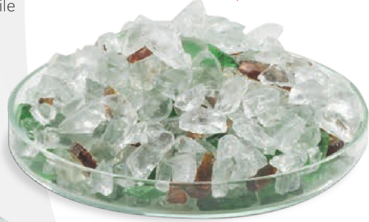
Ham madde atık kırık camlar